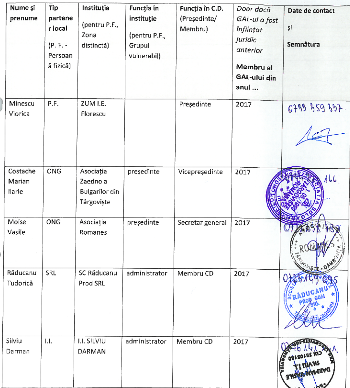
Tabel 1. Componența Comitetului Director

► Informațiile vor fi furnizate pe modelul prezentat în Tabelul 4.